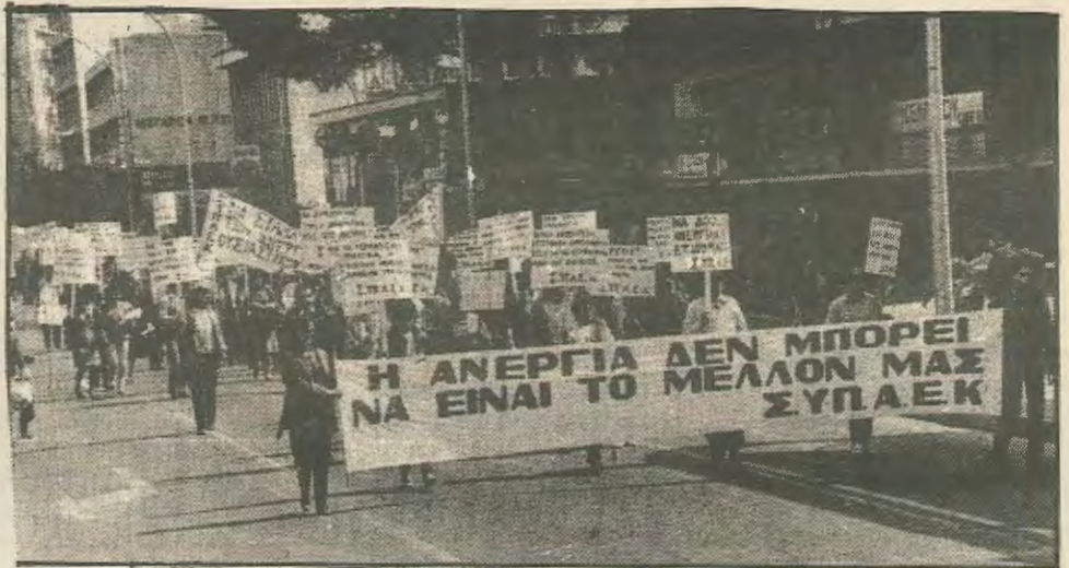
Οι άνεργοι επιστήμονες διεκδικούν το δικαίωμα επιβίωσης.